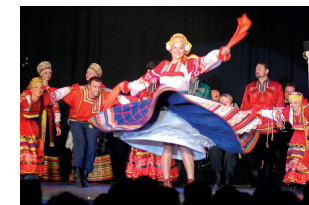
43 e Festival (2003) - Russie