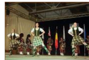
41 e Festival (2000) - Ecosse