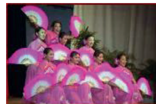
41 e Festival (2000) - Chine

C'est grâce à la musique et à la danse, véritables moyens de communication et d'entente entre les hommes, que notre cité est devenue pendant un temps le cœur du monde.