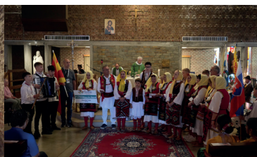
Messe à l'Eglise St Symphorien 63 e Festival (2025) : Macédoine du Nord