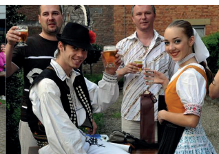
Slovaquie 39 e Festival (1998) : Hongrie