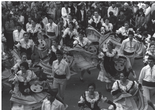
1 er Festival (1958) : Nice - France