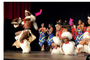
49 e Festival (2009) - Afrique du Sud