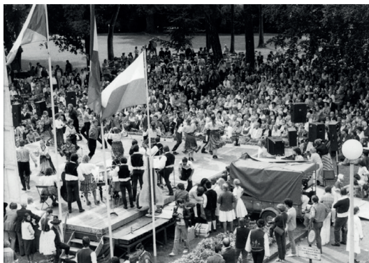
2 e Festival (1981) : Parc Astrid - Jambes

Créé en 1958, le festival de folklore de Jambes-Namur est un Festival de renommée mondiale reconnu par le CIOFF (Comité International des Organisateurs de Festivals de Folklore) et partenaire de l'UNESCO, profondément attaché aux traditions, et porté par la passion d'une poignée de bénévoles qui souhaitent le maintenir sur la scène nationale et internationale.