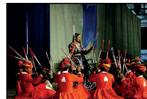
42 e Festival (2002) - Inde