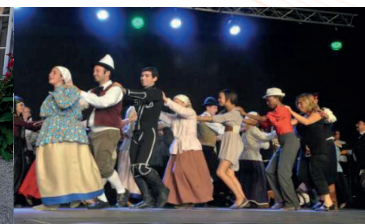
Soirée de clôture 52 e Festival (2011)