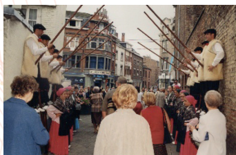
Sortie de la Messe 41 e Festival (2000) : France (Landes)

En l'espace de quelques jours : « Jambes sera à nouveau, la Capitale Mondiale du Folklore ». La fête sera au rendez-vous ! C'est : « The place to be ».