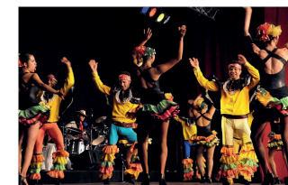
48 e Festival (2008) - Colombie