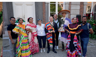
Réception Gouverneur 63 e Festival (2025)