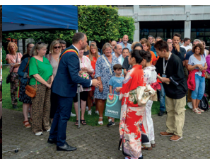
Réception Jardins du Maieur 62 e Festival (2024)