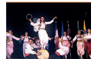
42 e Festival (2001) - Bosnie